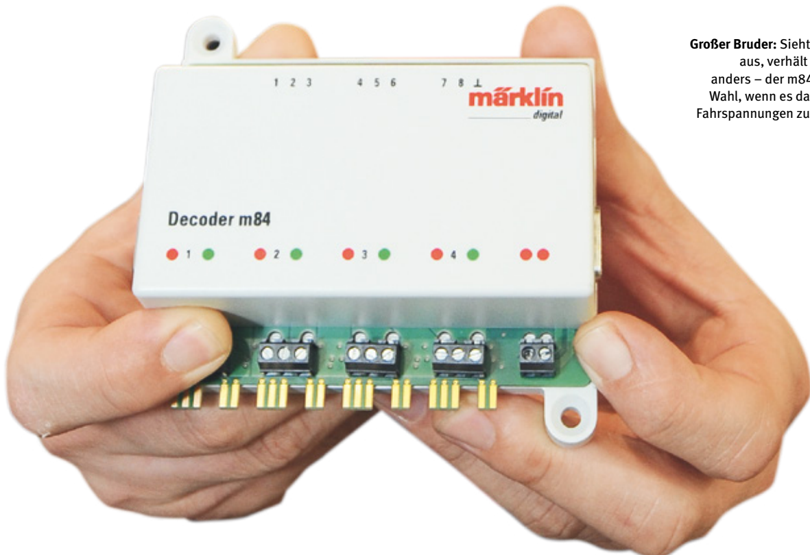
Großer Bruder: Sieht genauso aus, verhält sich aber anders – der m84 ist erste Wahl, wenn es darum geht, Fahrspannungen zu schalten.

Wichtig: Bei der Mobile Station und der Central Station muss natürlich auch das Datenformat für das Schalten des entsprechenden Magnetartikels auf DCC umgestellt werden. Diese DCC-Programmierung funktioniert übrigens auch während des Betriebes (POM). Es ist also nicht notwendig, den Decoder m83 zum Umprogrammieren an das →