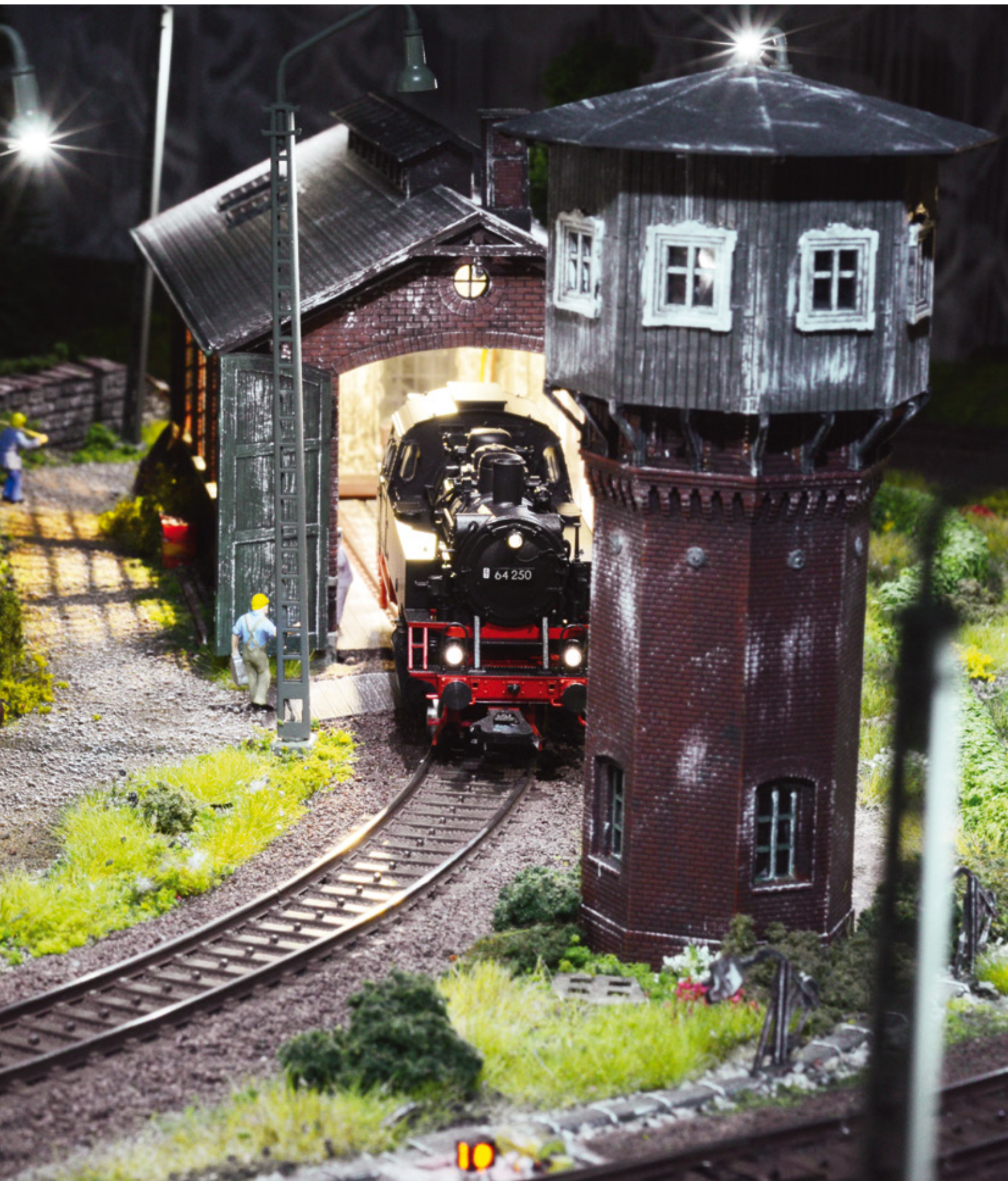
Authentisch: Mit dem Decoder m83 lässt sich auch das Flackern der Neonröhren im Lokschuppen realistisch darstellen.