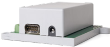
Unscheinbarer Kasten: Mit dem neuen Decoder m83 lassen sich nun auch Lichteffekte programmieren.

→ Die Unterschiede liegen im Detail: Der Decoder m83 übernimmt die Versorgung des angehängten Verbrauchers selbst. Beim Decoder m84 haben wir hingegen Ausgänge, bei denen wir selbst bestimmen können, welche Versorgungsspannung wir ein- und ausschalten. Eine Fahrspannung zu schalten, ist daher auch weiterhin eine der Domänen des Decoders m84. Eine Lichtversorgung hingegen kann nun auch alternativ sehr gut vom Decoder m83 vorgenommen werden.